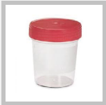
Semen culture test Detection of DNA or bacteria antigen or virus in seminal fluid

After abundant urination and thorough cleaning of the external genitalia, collect the sample, by masturbation, in a sterile wide-mouth container with a screw cap, like the one shown in the photo. To undergo the test, you must abstain from sexual intercourse in the 3-4 days prior to the test. Do not carry out the test if you are taking antibiotics or if you have stopped taking them for less than a week. Place the container in a transparent bag with pressure closure and deliver it at the latest one hour after collection by 10 am.