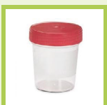
Culture test of the sputum

In the morning, on an empty stomach and after a thorough cleaning of the oral cavity and gargles with water, collect the sputum, after strong coughs, directly into the sterile wide-mouth container with screw